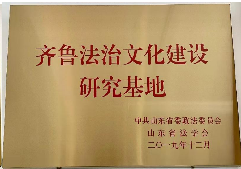
齐鲁法治文化建设研究基地