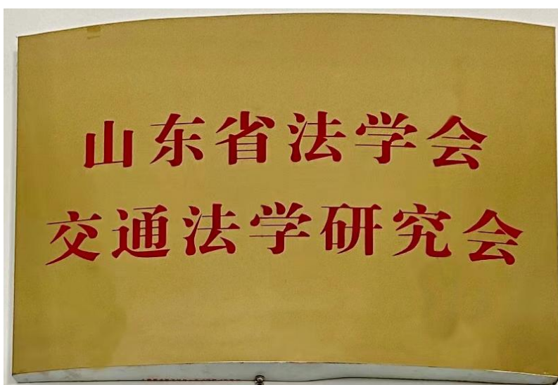
山东省法学会交通法学研究会