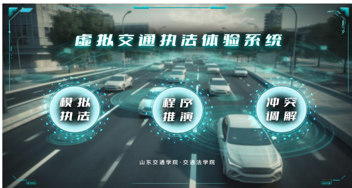
虚拟交通执法体验系统